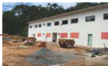
Obra do novo Ambulatório.