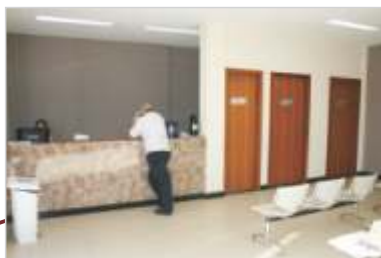
Ampliação Serviço de Endoscopia.