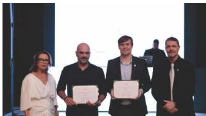
Representantes da LM e do Sicoob