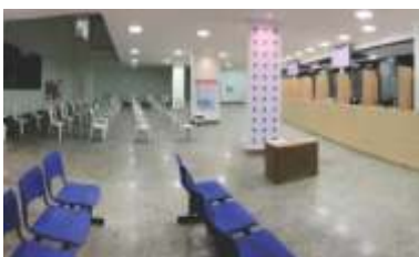
Inauguração do novo Ambulatório Oftalmologia.