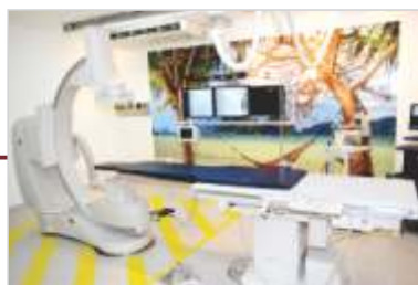
Nova sala e nova máquina de Hemodinâmica.