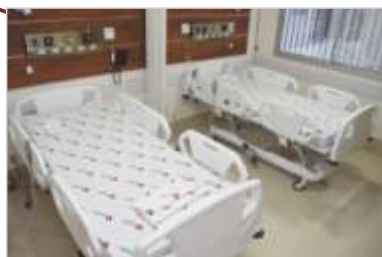
Nova Unidade de Internação.