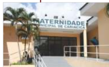
Gestão da Maternidade Municipal de Cariacica.