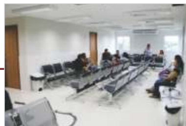
Ampliação Serviço de Oftalmologia.