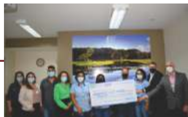
Parceria com a Farmácia Mônica no Projeto Troco Solidário.