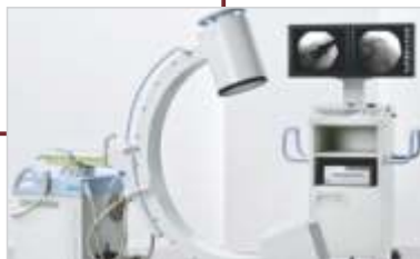
Aquisição de Arco Cirúrgico.