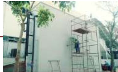
Instalação da Estação de tratamento de esgoto.