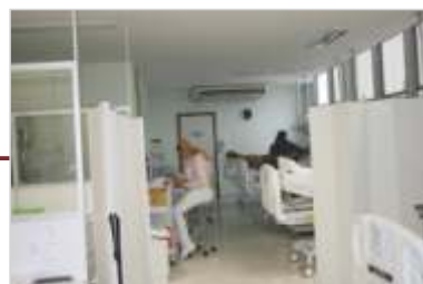
Unidade de Transplante de Órgãos.