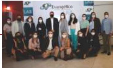
Lançamento do Laboratório de Inovação, EvangélicoLAB.