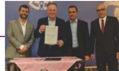
Governo do Estado Lança Mutirão de Cirurgias Eletivas.