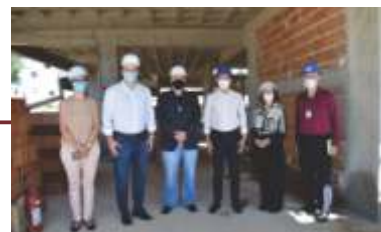
Visitas do Governador, Renato Casagrande, da Vice-governadora, Jacqueline Moraes e do Prefeito de Vila Velha, Arnaldinho Borgo, na obra da Unidade de Alta Complexidade em Oncologia - Unacon.