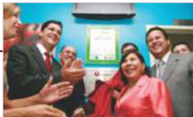
Serviço de Oncologia, o primeiro e único da microrregião de Vila Velha.