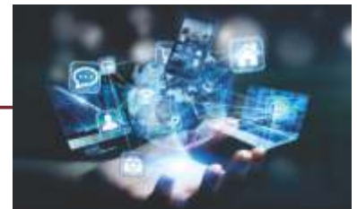
Início do Projeto de Transformação Digital.