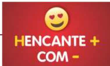
Plano de Sustentabilidade