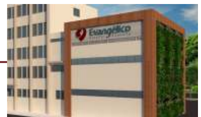
Ampliação do Centro Cirúrgico.