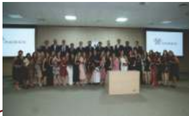
Formatura da 3ª turma de Residência Médica e 1ª turma de Residência Multiprofissional.