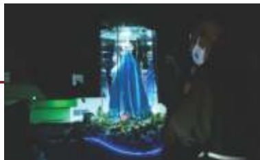
Romaria da Família passa em frente ao HEVV.