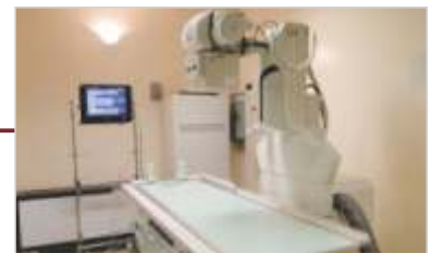
Aquisição de Aparelhos de Raios-x, Telecomandado e Portátil.