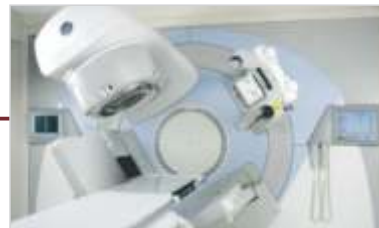
Aquisição do Acelerador Linear.