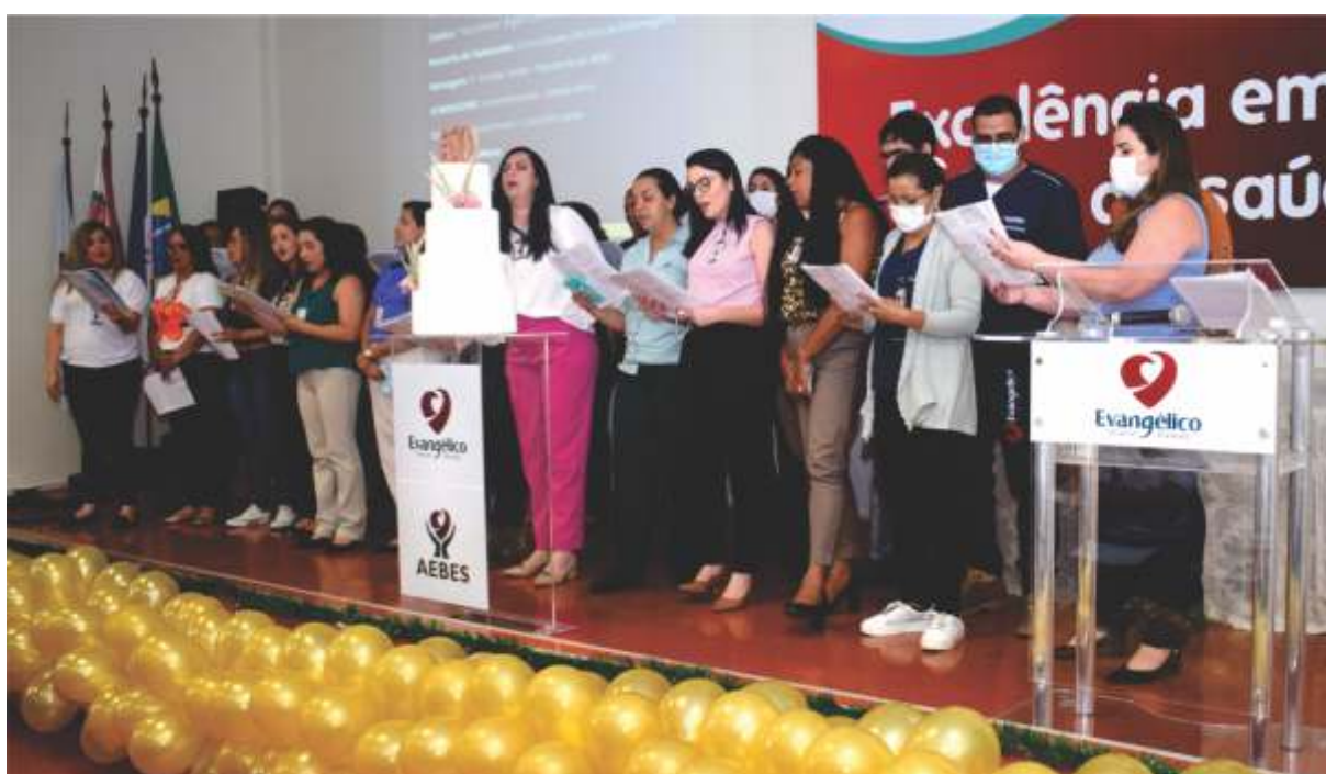
Grupo de colaboradores cantando músicas natalinas