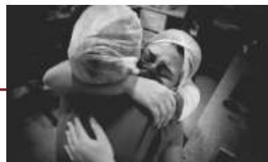
Documentário "Por dentro da UTI", de A Gazeta (por Carlos Alberto Silva), registrou momentos emocionantes vividos dentro dos hospitais no período da pandemia.