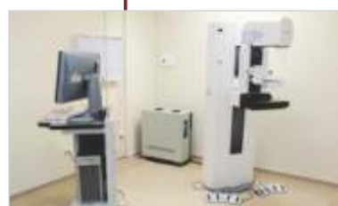
Aquisição de Mamógrafo Digital, Lavadora Ultrassônica, Termodesinfectora e Autoclave.