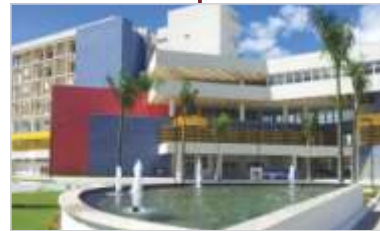
Gestão do Hospital Estadual Dr. Jayme dos Santos Neves.