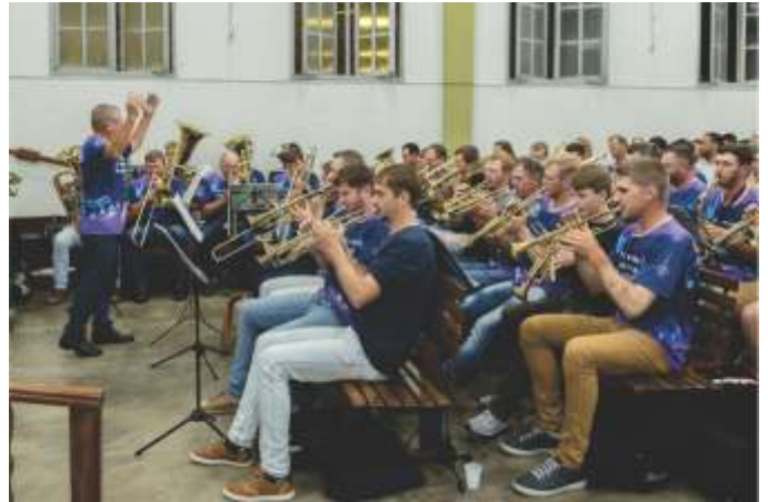
Grupo de trombonistas Obra Acordai Capixaba Coro Metais