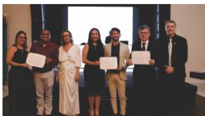
Representantes da Sollo Brasil, do Banestes e da Unimed Vitória / Instituto Unimed Vitória