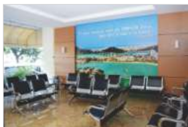
Modernização da Recepção de Internação.