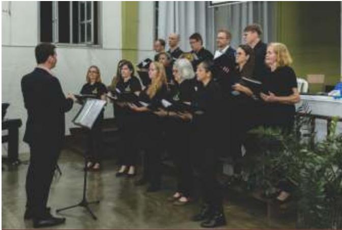
Coral Bom Pastor