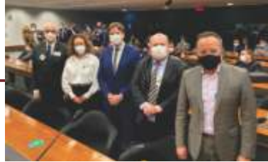
Reunião na Câmara dos Deputados em Brasília.