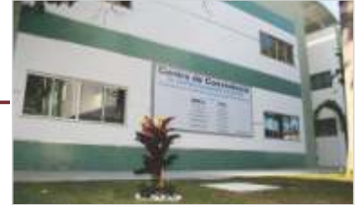
Centro de Convivência.