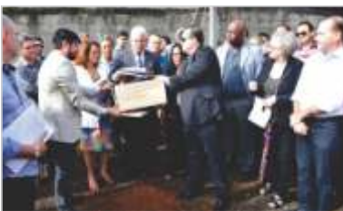
Lançamento da Pedra Fundamental do Hospital Oncológico.