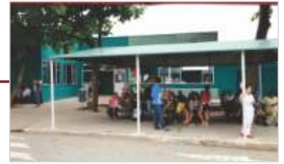
Reforma da Lanchonete.