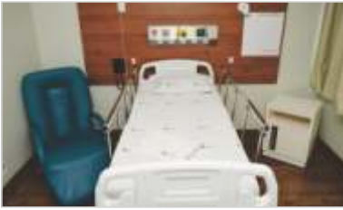
Reforma de Apartamentos.