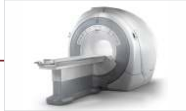
Aquisição de Ressonância Magnética.