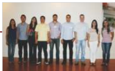
Início das atividades do Centro de Ensino e Aperfeiçoamento em Pesquisa - CEAP, com a 1ª turma de Residência Médica.