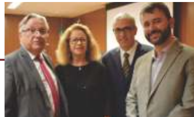
1º Workshop sobre "O papel das Organizações Sociais na Rede de Saúde Pública".