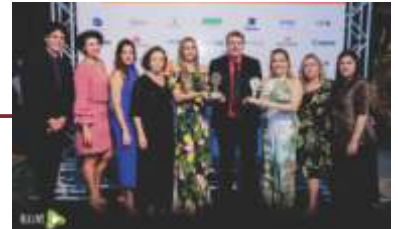
Prêmio Luiz Nivaldo da Silva de Boas Práticas.