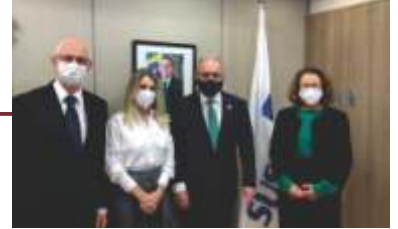
Visita ao Ministro da Saúde, Marcelo Queiroga, em Brasília, acompanhados da deputada federal Soraya Manato.