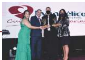
Prêmio Valor Empresarial.