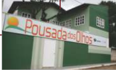
Pousada dos Olhos.