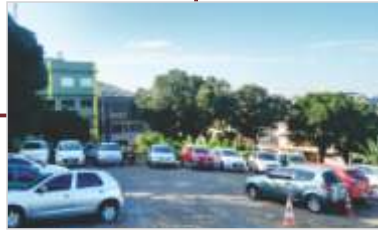
Novo Estacionamento para Funcionários.