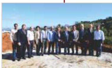
Governador Paulo Hartung visita local onde será construído o Hospital Oncológico.