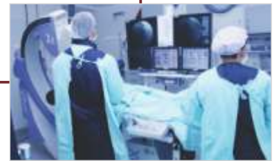
Ampliação do Serviço de Hemodinâmica.