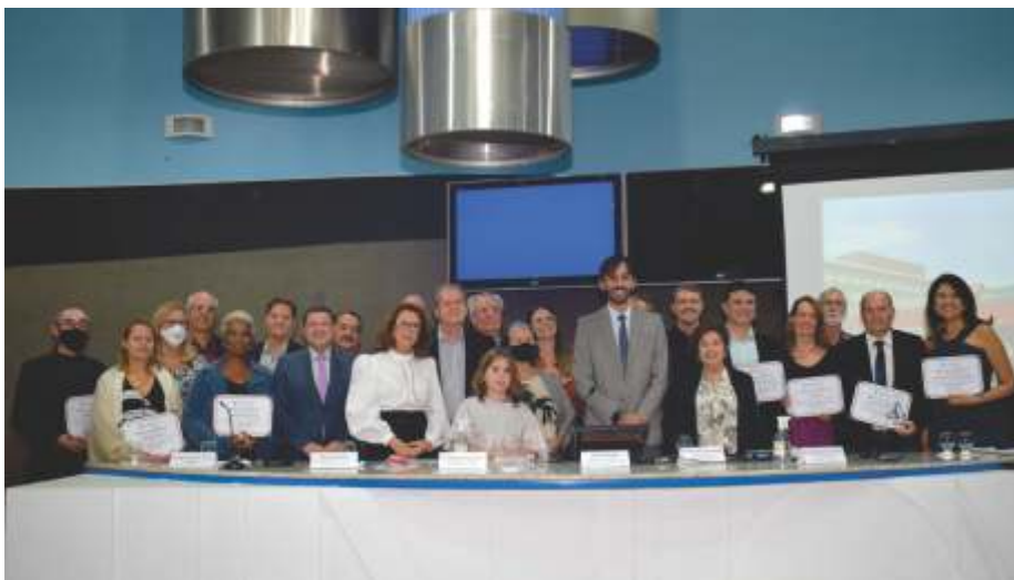
Homenageados na sessão solene em Vitória

Nas sessões, foi ressaltada a atuação do HEVV na área da saúde, sempre pautada na ética cristã, integridade e equidade. Valores que foram levados para outras unidades hospitalares que são geridas pela Aebes como o Hospital Estadual Dr. Jayme Santos Neves, Hospital Estadual de Urgência e Emergência e a Maternidade Municipal de Cariacica.