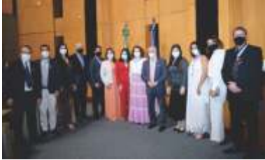
Sessão Solene na ALES pelos 65 anos da Aebes.