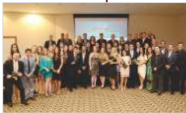
Formatura da 1ª Turma de Residência Médica.