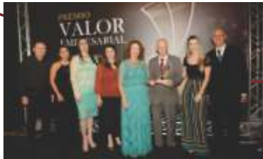
Prêmio Valor Empresarial.