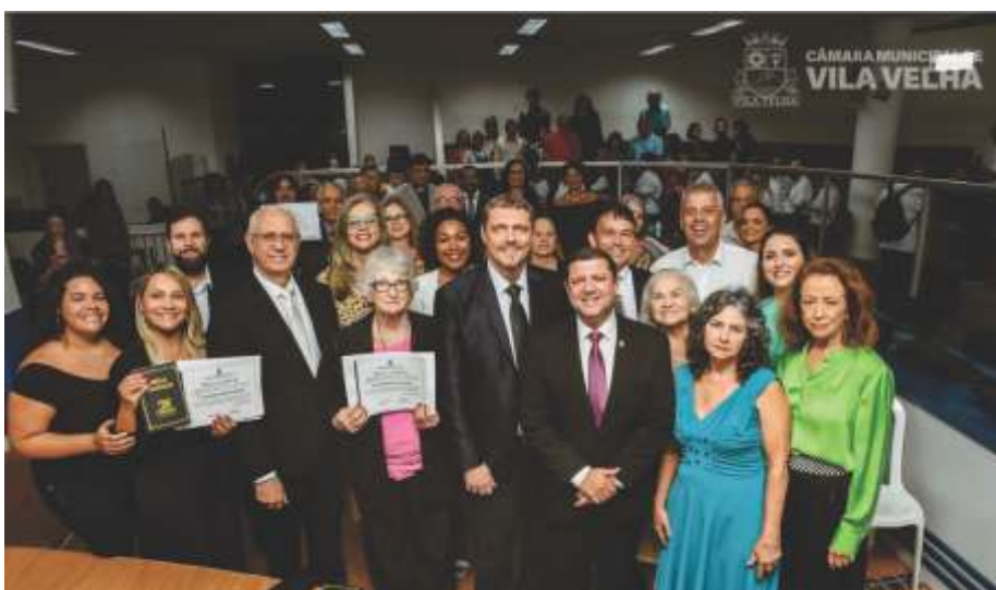
Homenageados na sessão solene em Vila Velha