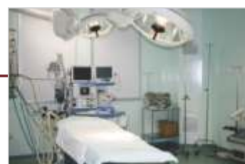
Reforma e modernização do Centro Cirúrgico.