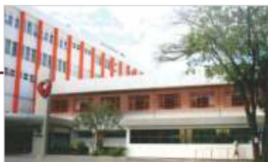
Pintura do Prédio Assistencial.