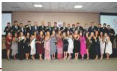
Formatura da 4ª turma de Residência Médica e 2ª turma de Residência Multiprofissional.