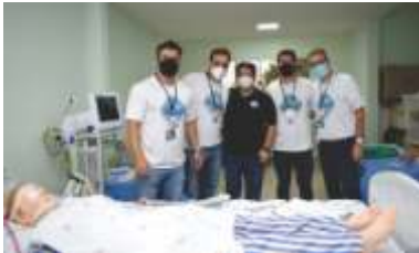
Realização do 1º curso Fast ECMO.