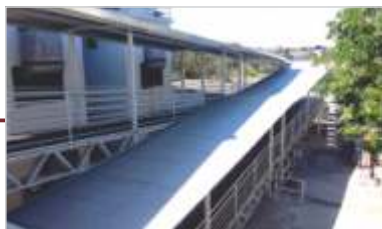
Diversas melhorias na infraestrutura predial.