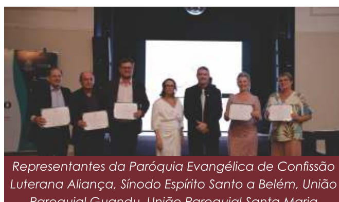
Representantes da Paróquia Evangélica de Confissão Luterana Aliança, Sínodo Espírito Santo a Belém, União Paroquial Guandu, União Paroquial Santa Maria e Paróquia Evangélica de Confissão Luterana Unida