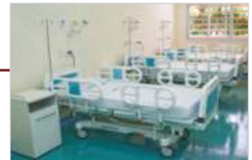
Centro de Referência Cardiovascular.