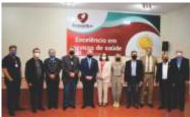
Visita do Ministro da Saúde, Marcelo Queiroga, no HEVV.