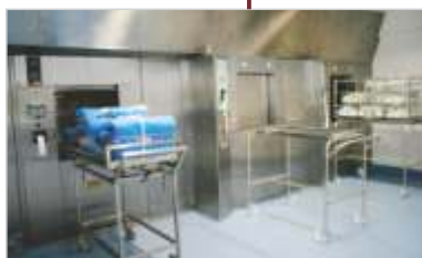
Centro de Material Esterilizado.