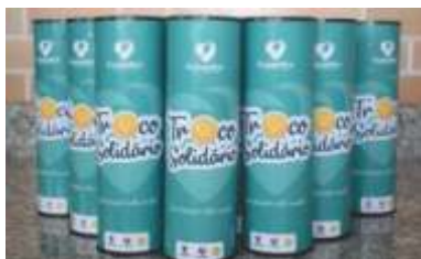
Início do Projeto Troco Solidário