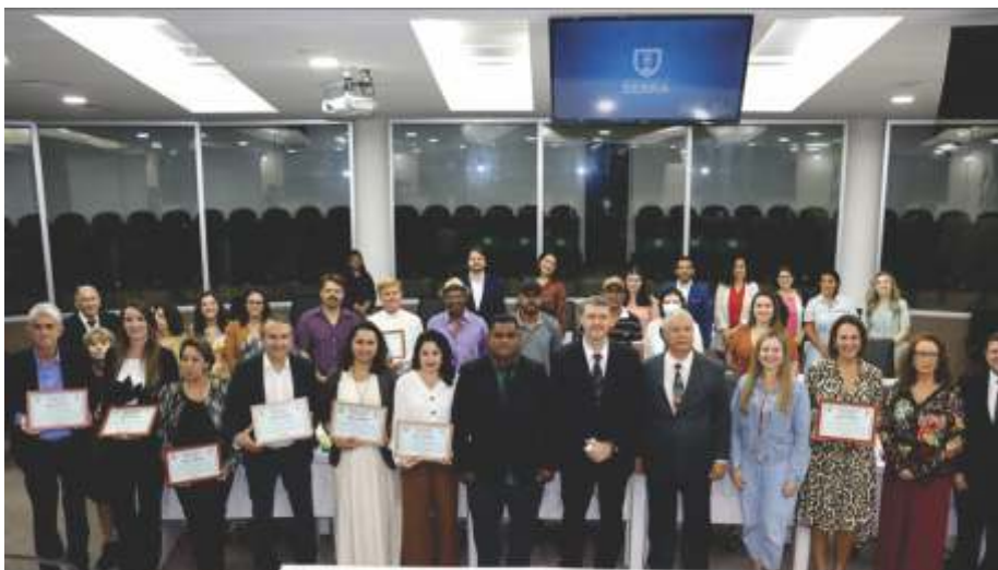
Homenageados na sessão solene em Serra