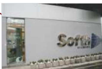
Banco de Olhos.