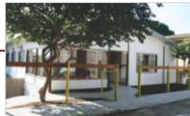
Aquisição de imóvel para abrigar os exames cardiológicos.