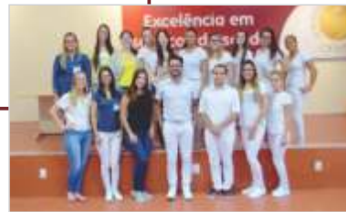
1ª Turma de Residência Multiprofissional.