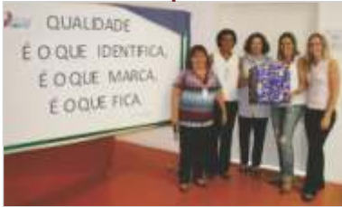
Início do Projeto Acreditação Hospitalar.