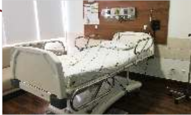
Conclusão da reforma dos apartamentos.