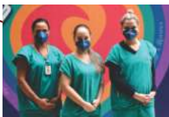
Ações de enfrentamento à Covid-19.